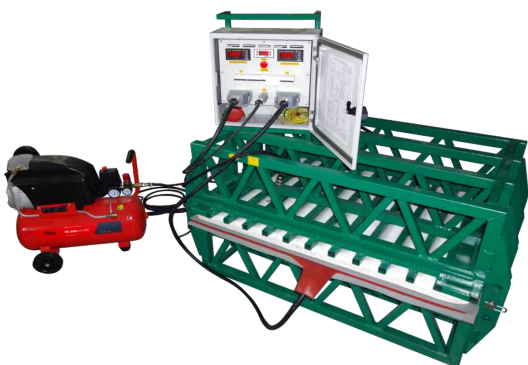
Вулканизатор конвейерный ВК-1000/750